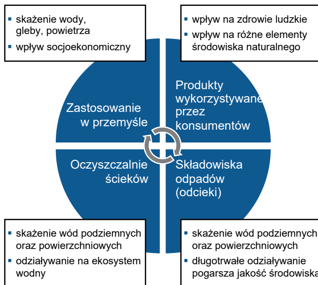
Rys. 1. Obieg związków PFASs w środowisku (opracowanie własne na podstawie [45])

Inertność, trwałość, stabilność i siła wiązania C – F powodują, że zarządzanie i kontrolowanie obecności w powietrzu, wodzie i glebie związków chemicznych z grupy PFASs jest trudne. Ich występowanie w elementach środowiska naturalnego jest bardzo zróżnicowane i zależy między innymi od budowy chemicznej, przykładowo izomery rozgałęzione wykazują większe powinowactwo do środowiska wodnego, natomiast cząsteczki liniowe są częściej odnajdywane w glebie [45]. Transport atmosferyczny odgrywa kluczową rolę w globalnej dystrybucji. Należy zaznaczyć, że po uwolnieniu do środowiska, wykorzystując procesy wymywania, wytrącania, podziału i rozkładu, PFASs mogą być przenoszone na duże odległości i dlatego znajdują się w różnych środowiskach naturalnych na całym świecie. Przykładowo, szybkość rozkładu PFASs zależy od dostępności tlenu, w warunkach beztlenowych i w osadach morskich jest odmienna niż w glebach z obecnością tlenu, czego konsekwencją jest znaczna zmienność w możliwościach biotransformacji, co powoduje odmienny rozkład stężeń przy porównywaniu takich miejsc jak składowiska odpadów, oceany lub gleby. Jednak mobilność tych związków w warunkach lądowych zmniejsza się wraz ze wzrostem masy cząsteczkowej przy jednoczesnym wzroście bioakumulacji [38, 46, 47]. Na rysunku 1 przedstawiono obieg związków PFASs w środowisku oraz skutki ich występowania w poszczególnych obszarach.